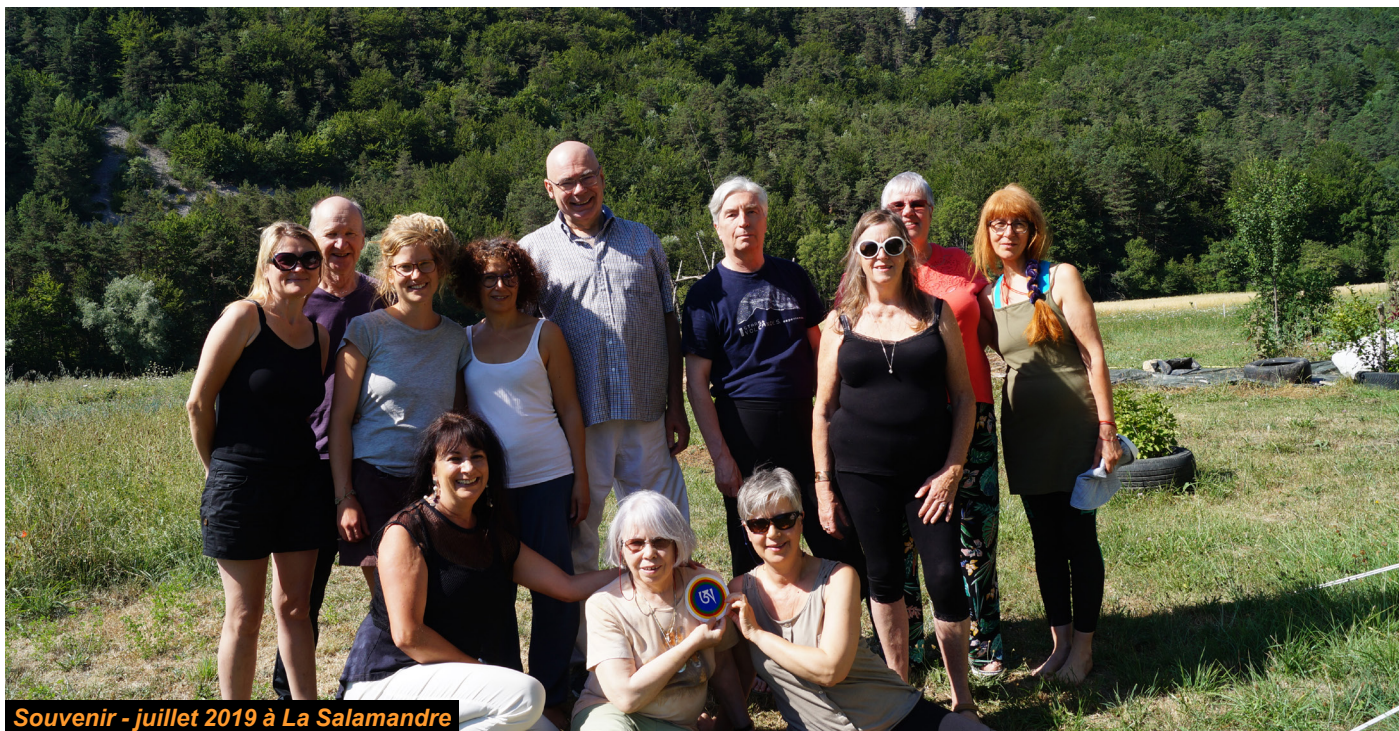
Souvenir - juillet 2019 à La Salamandre

Pour plus d'informations et pour vous s'inscrire, veuillez contacter :